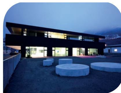
Nouvelle école de Châteauneuf

vos dispositions dans ce sens. Nous rappelons également l'importance et l'obligation d'informer le titulaire de toute absence de votre enfant, par téléphone et avant le début de la classe. Sans nouvelles de votre part, les titulaires doivent informer la direction qui entreprendra les démarches nécessaires.